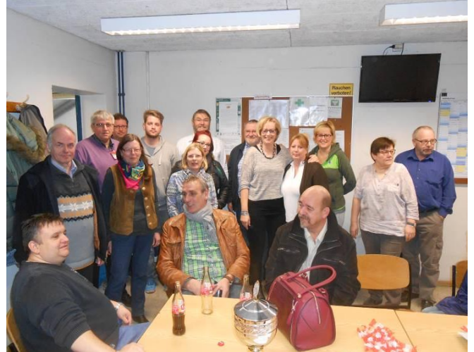
Es waren doch viele gekommen