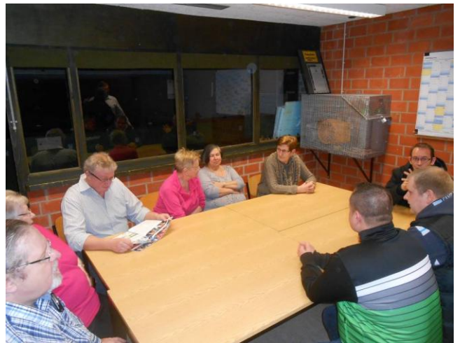
Gleich sind dran, dann geht es los