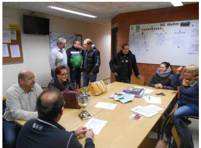
Gute Stimmung ist angesagt