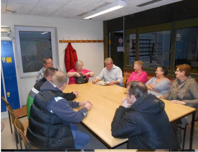
Das Wartezimmer war ganz schön voll

gut Schuss...Bericht/Bilder Christian Storms