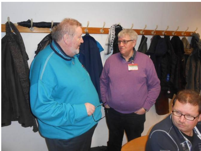
Der Präsi hat bestimmt Null-Ahnung